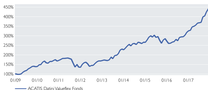
— ACATIS Datini Valueflex Fonds